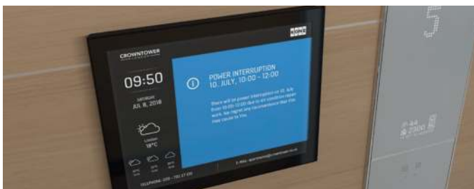
MEDIASCREEN EIN DISPLAY IM AUFZUG