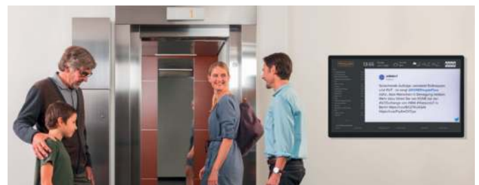
MEDIAPLAYER AUSGABEMÖGLICHKEIT IM FOYER